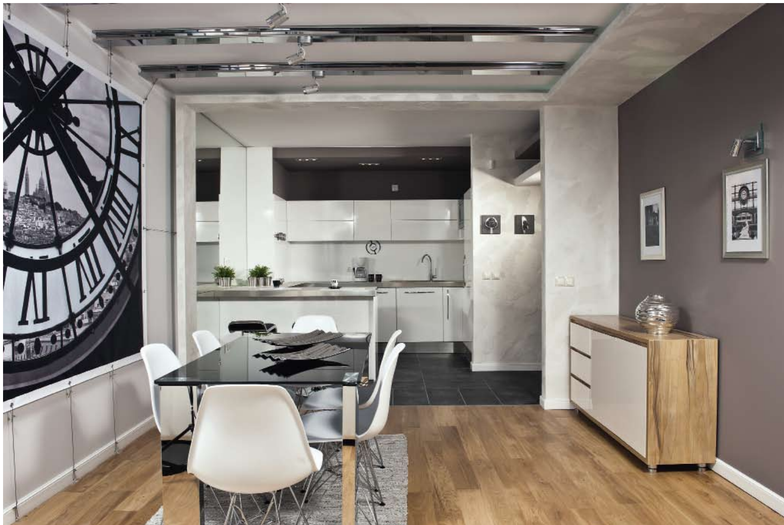
# Поставена в най-тъмната част на дневното пространство, кухнята е изцяло в бяло.