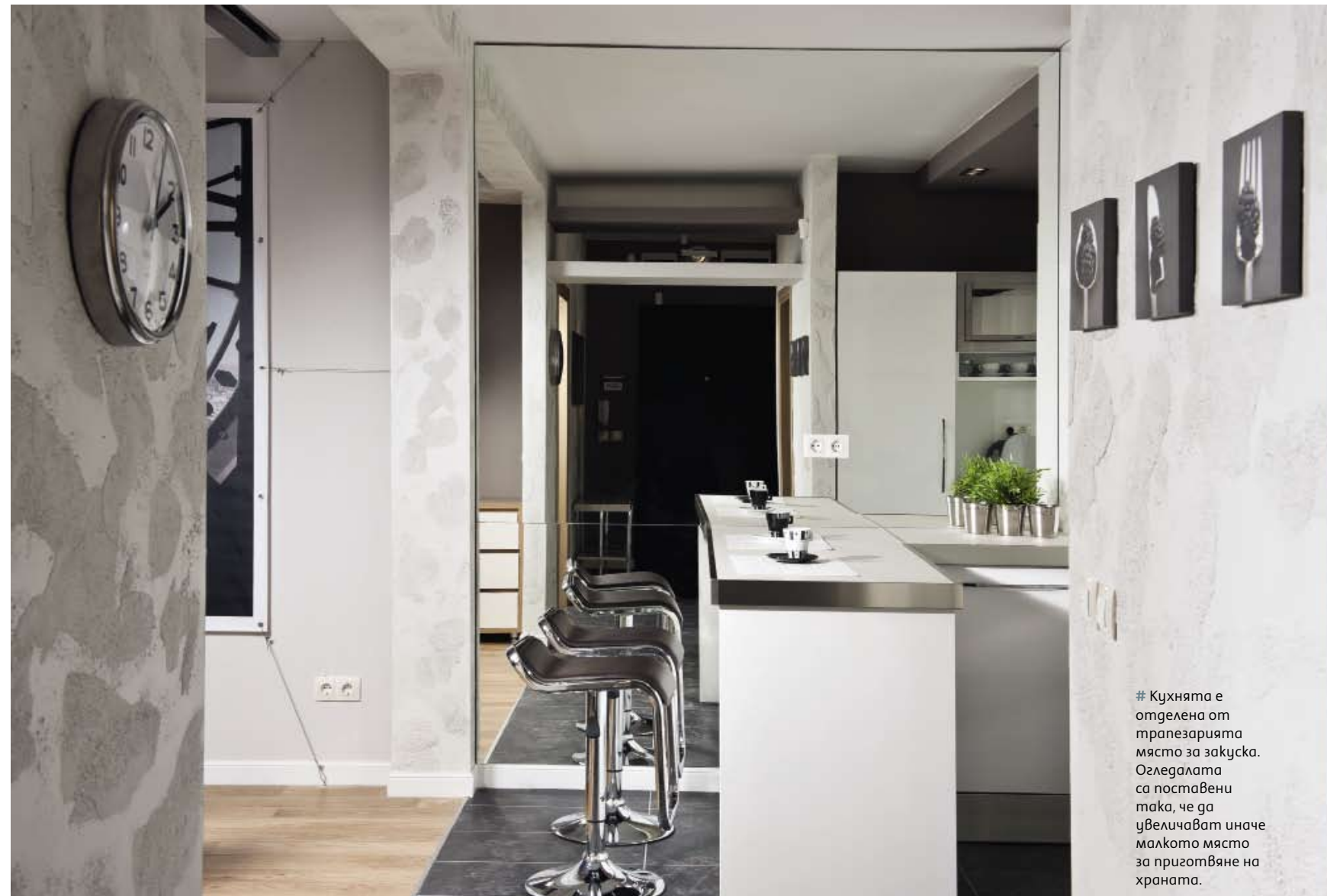
# Кухнята е отделена от трапезарията място за закуска. Огледалата са поставени така, че да увеличават иначе малкото място за приготвяне на храната.