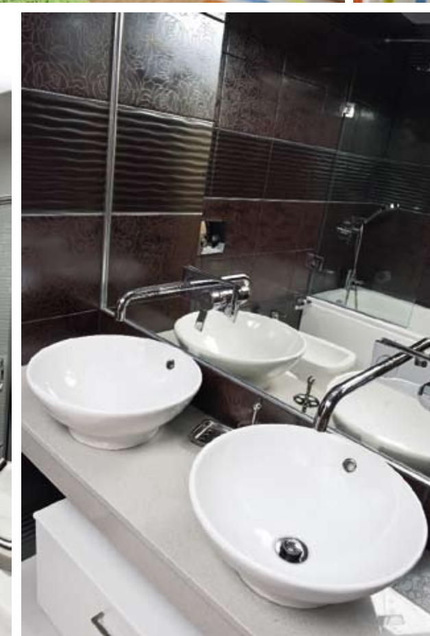
# За да не се повреждат от влагата, плотовете в банята са каменни, а шкафовете – от PVC.